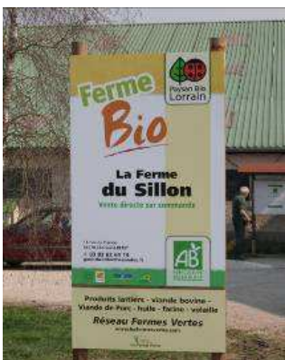
Exemple d'un panneau devant une ferme

Patrice MULLER - CFPPA de METZ Courcelles-Chaussy